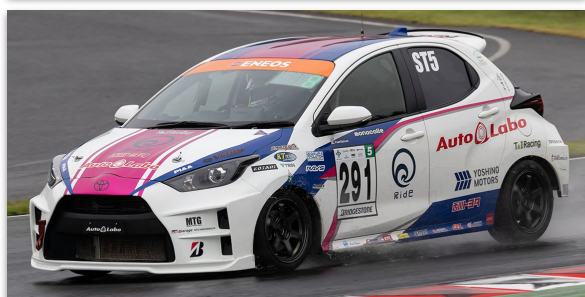
ST-5Fクラス No.291 AutoLabo Racing 素ヤリス