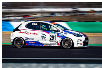
▲快走する素ヤリス