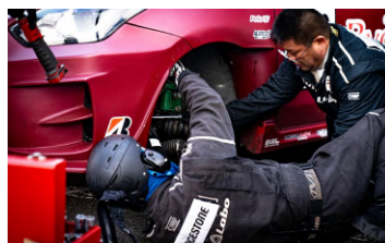
▲迅速に行われた修復作業