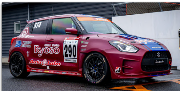
ST-4クラス No.290 AutoLabo Racing スイフトスポーツ

2026年シーズンがいよいよ開幕を迎えた。スイフトスポーツはオフシーズンの間に様々なアップデートが加えられただけでなく、東京オートサロンではスズキ株式会社様の公式ブースへの出展を果たすなど、メディア・世間の認知を集めている。スーパー耐久シリーズも人気を高めており、エントリーカテゴリである「S耐チャレンジ」を年間3戦開催することが確定し、新規参戦チームも大幅に増えた。AutoLaboとしてもマネージャー陣の「Sチャレ」全戦参戦が決まっている。去年よりもパワーアップした2026年が幕をあける。